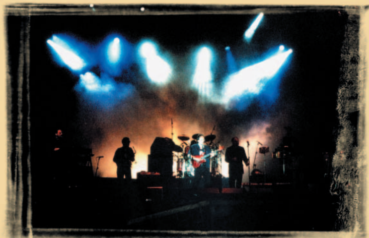
Grafik: www.logopilot.de

Postfach 400139 D-70761 Leinfelden-Echterdingen Tel.: +49 (0)711 · 754 67 05 Fax: +49 (0)711 · 797 96 39 Mail: info@agualoca.de Net: www.agualoca.de